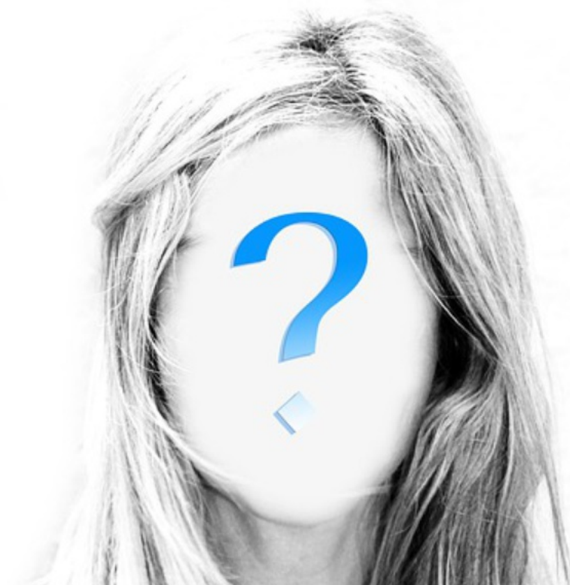
Illustration d'une enfant se posant des questions philosophiques

Delphine Bancaud | Publié le 17/04/19 à 07h05 — Mis à jour le 17/04/19 à 09h48